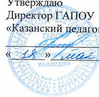
График защиты выпускных квалификационных работ 244 группы специальности 04.02.02 Преподавание в начальных классах за 2022-2023 учебный год