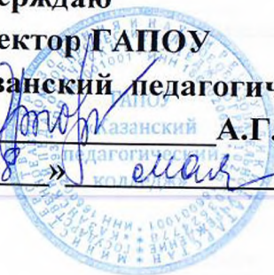
График защиты выпускных квалификационных работ 243 группы специальности 04.02.02 Преподавание в начальных классах за 2022-2023 учебный год